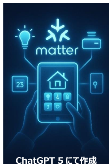
ChatGPT 5 にて作成

ブースでは Matter でつながるスマート家電を原理試作で制御する様子を展示します。